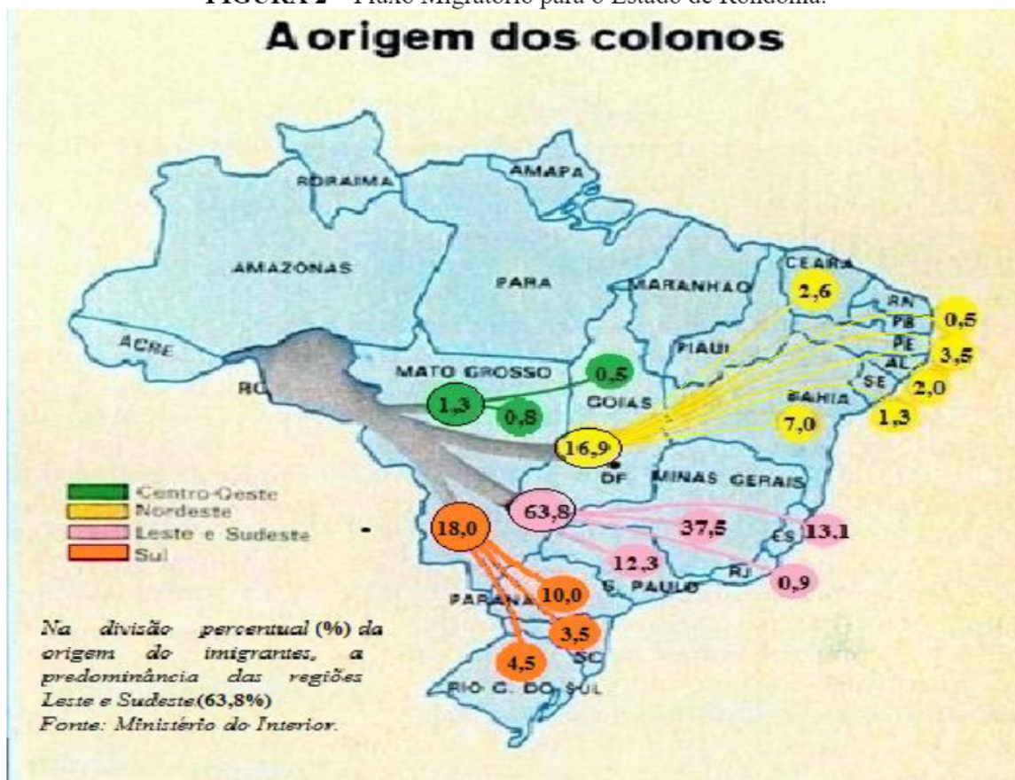
FIGURA 2 – Fluxo Migratório para o Estado de Rondônia.